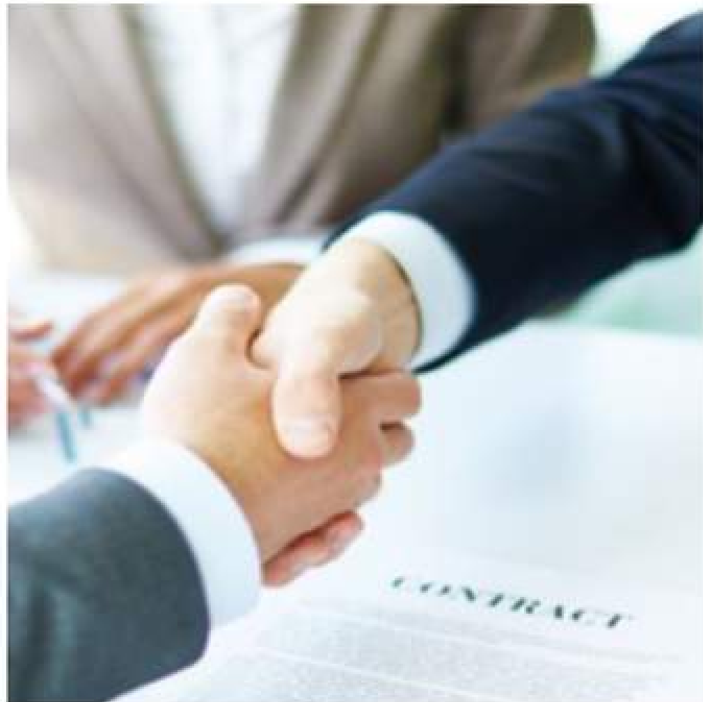
Universal Postal Union (Nomeação 2022)